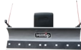
Gerader Pflug für UTV