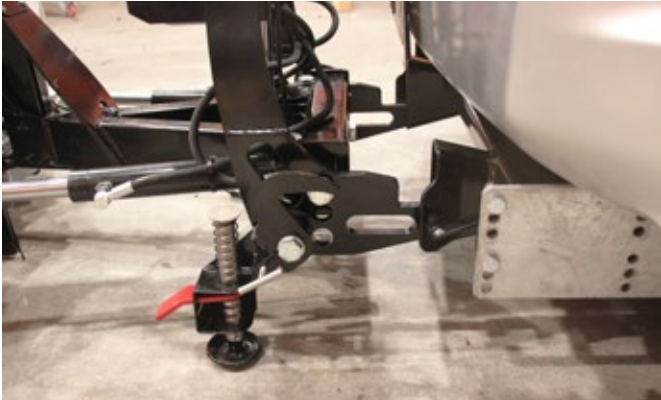
Hilltip Quick Hitch Schnellmontagesystem