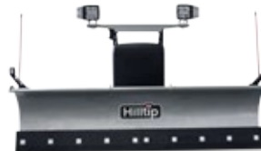
Gerader Pflug für Pickup