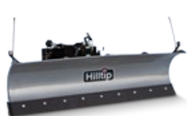
Gerader Pflug für LKW

Das gewölbte, pulverbeschichtete Schild ist aus robustem Stahl gefertigt, der in diesem Fall der Schlüssel zu unserem widerstandsfähigen und dennoch leichten Pflug ist. Die regulierbare Schürfleiste ist in Polyurethan oder Stahl erhältlich.