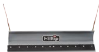
Gerader Pflug für Traktoren