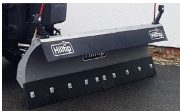
Poly-Schneeabweiser für Gerade-Pflug (optional)