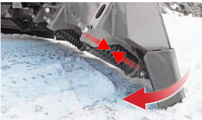
Schürfleiste mit Absorber-Federn