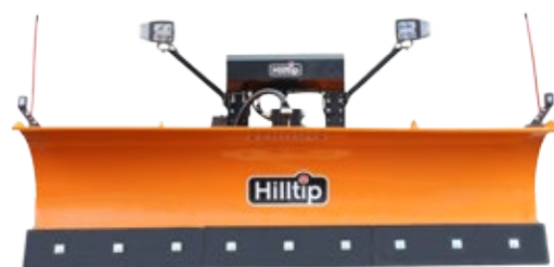
Orange SML-Schneepflug mit LED Scheinwerfern