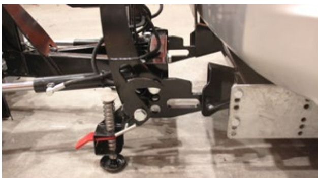
Hilltip Quick Hitch Schnellmontagesystem